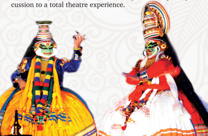
അത്താഴ വിരുന്ന് / Dinner രാത്രി 8:30ന് / 8:30 p.m.

ടിക്കറ്റുകൾ sruthi.treasurer@hotmail.co.uk വഴിയും നിങ്ങളുടെ സമീപമുള്ള, ചുവടെ കൊടുത്തിരിക്കുന്ന, ശ്രുതി അംഗങ്ങളിൽ നിന്നും ലഭിക്കും. നിരക്ക്: മുതിർന്നവർക്ക് £30, കുട്ടികൾക്ക് (5-12) £20.